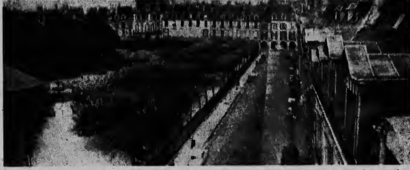
E arquitectonan encarga cu planeamento di Marais (Paris, Francia) y cu ta restaurando e edificacion bleue, ta basa nan planan riba e Place des Voges cu ta edifica na rand di e kwartier bleue na principio di siglo 17. Esaki ta un bista general di e plaza y e proporcionalnan gracioso di efachadanan.